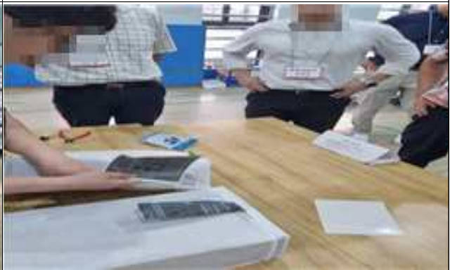
재외투표 보관봉투 봉인