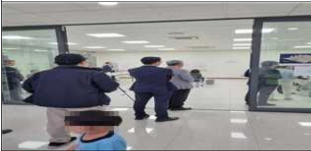
선거인 대기 투표소 전경