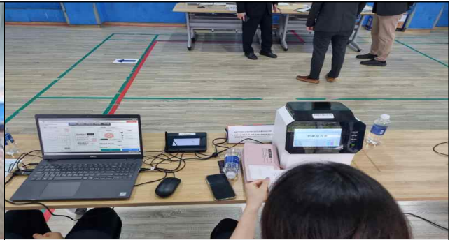
책임위원 도장 등록