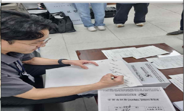
훼손된봉투 보관봉투 등 봉인