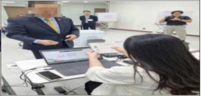
베트남 대사 투표