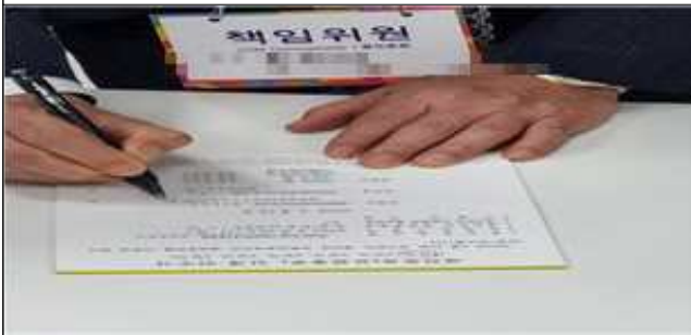
재외투표 인계인수서 작성