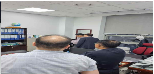
참관인 참관 재외투표 보관관리