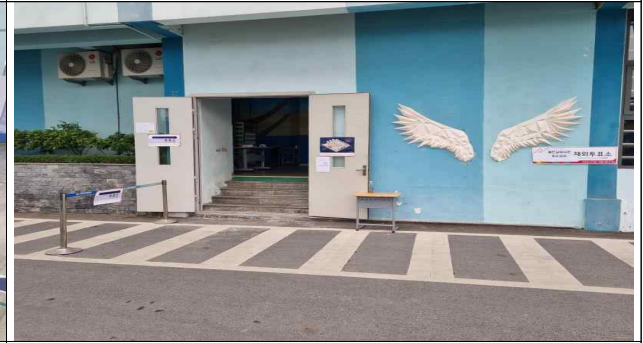
투표인증샷 장소 설비 등