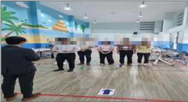
투표사무원 선서 및 운용장비 검사 등