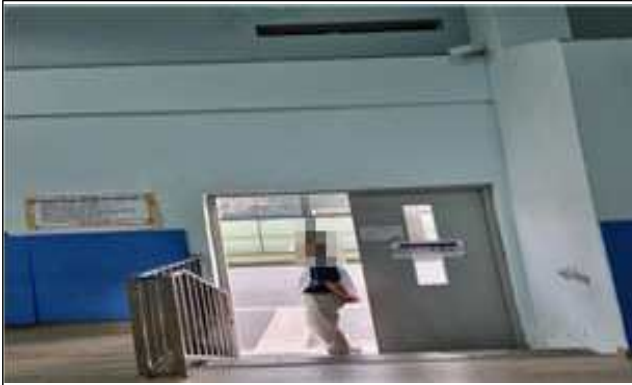
선거인 투표 안내