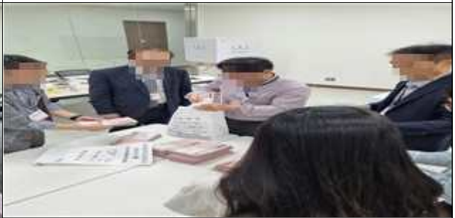
재외투표 보관상자 봉인