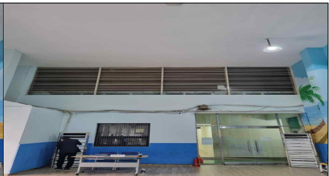
창문 가림막 조치 後