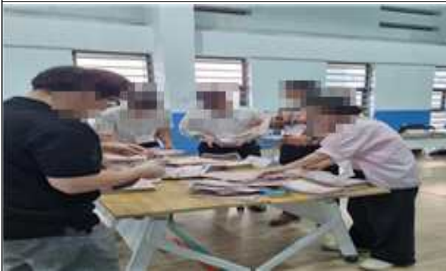
투표지 수 확인