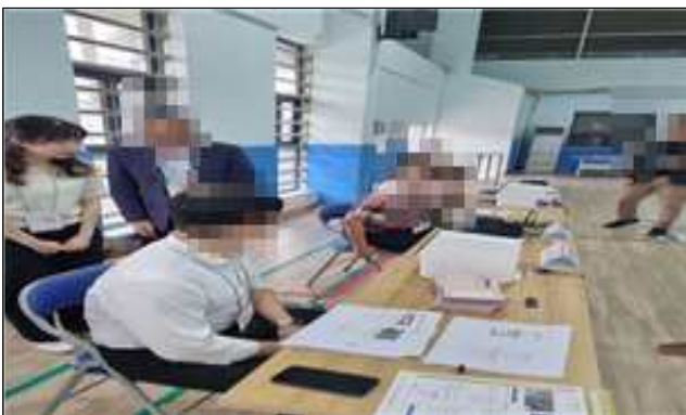
투표소 설비상황 확인·점검