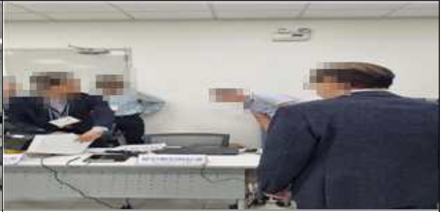
운영장비 이상유무 확인