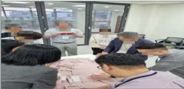
재외투표지 수량 확인