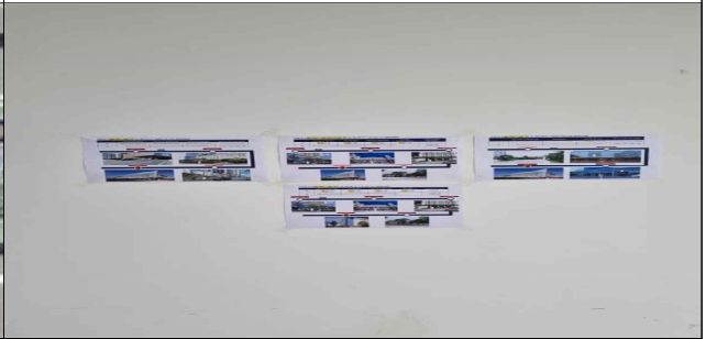
교통편의 운영 현황