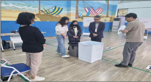
투표함 등 이상유무 검사