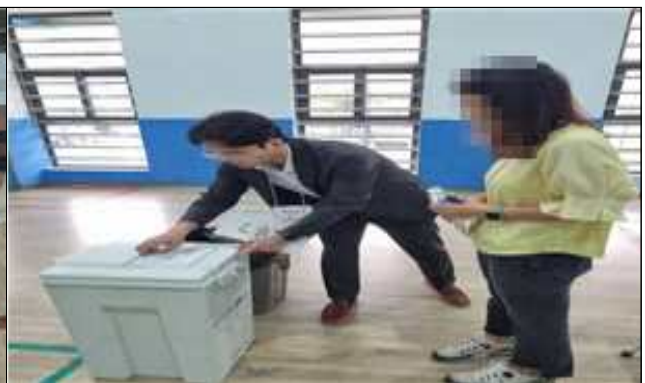
투표사무관계자 출석 확인 및 교육 실시